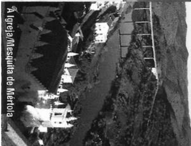
A Igreja/Mesquita de Mértola

Castelo de Beja A cidade capital do sul alentejano tem como principal ex-libris o seu Castelo, onde se destaca a famosa Torre de Menagem, construída no reinado de D. Dinis, e que é uma das mais elegantes e maiores da Península Ibérica totalmente feita em mármore, com 40 metros de altura e 198 degraus. Do alto, avista-se a planície em redor.