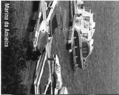
Marina da Amieira

Um Zoo de insetos O Capps insetozoo é um fascinante museu privado dedicado aos insetos sociais. Um museu vivo, já que ali encontramos, em expositores transparentes, vários tipos de formigas, abelhas, vespas e térmitas, e podemos ver como estes insetos vivem e como interagem socialmente. As crianças (e não só) adoraram.