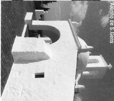
Alinhado de S. Gens